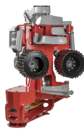
LOG MAX 3000T

Více informací najdete na: www.rottne.com